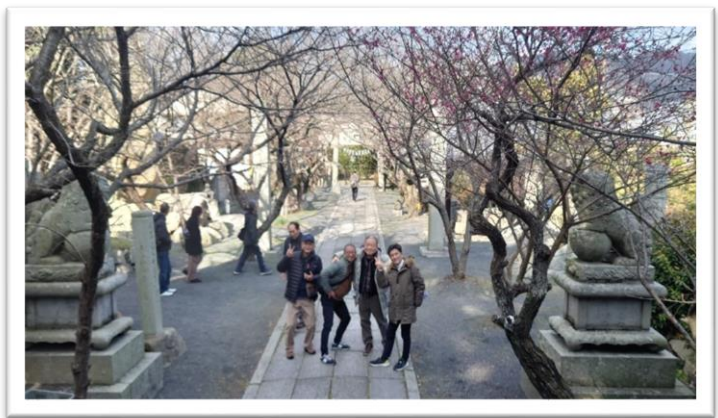
◎大崎下島 御手洗地区にも上陸