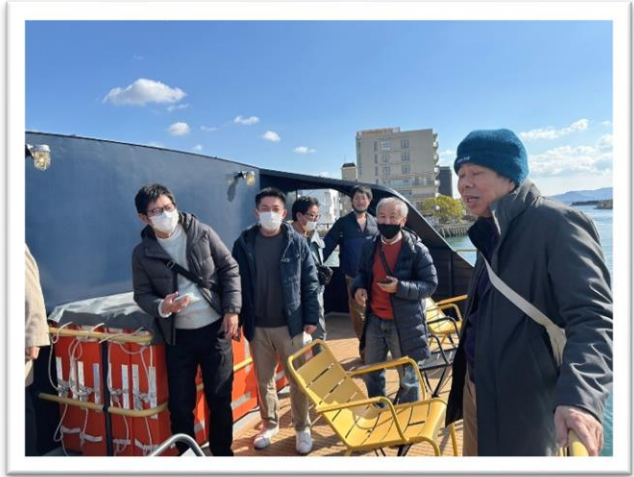
船内でお弁当を食べながら情報交換しました